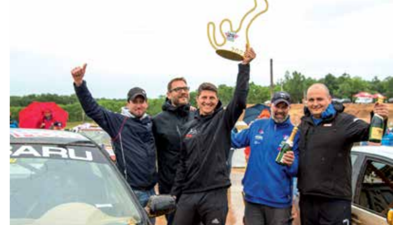
Das Team beim „24 Hours of Racing“ im Mai 2022 auf der Rallycross-Strecke Nyirad in Ungarn