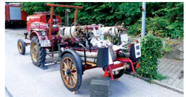
Moterspritze von 1932 vom Kloster Andechs

Unter den Besuchern waren viele Kameraden und Freunde von anderen Feuerwehren. Während die Erwachsenen bei Grillwurst